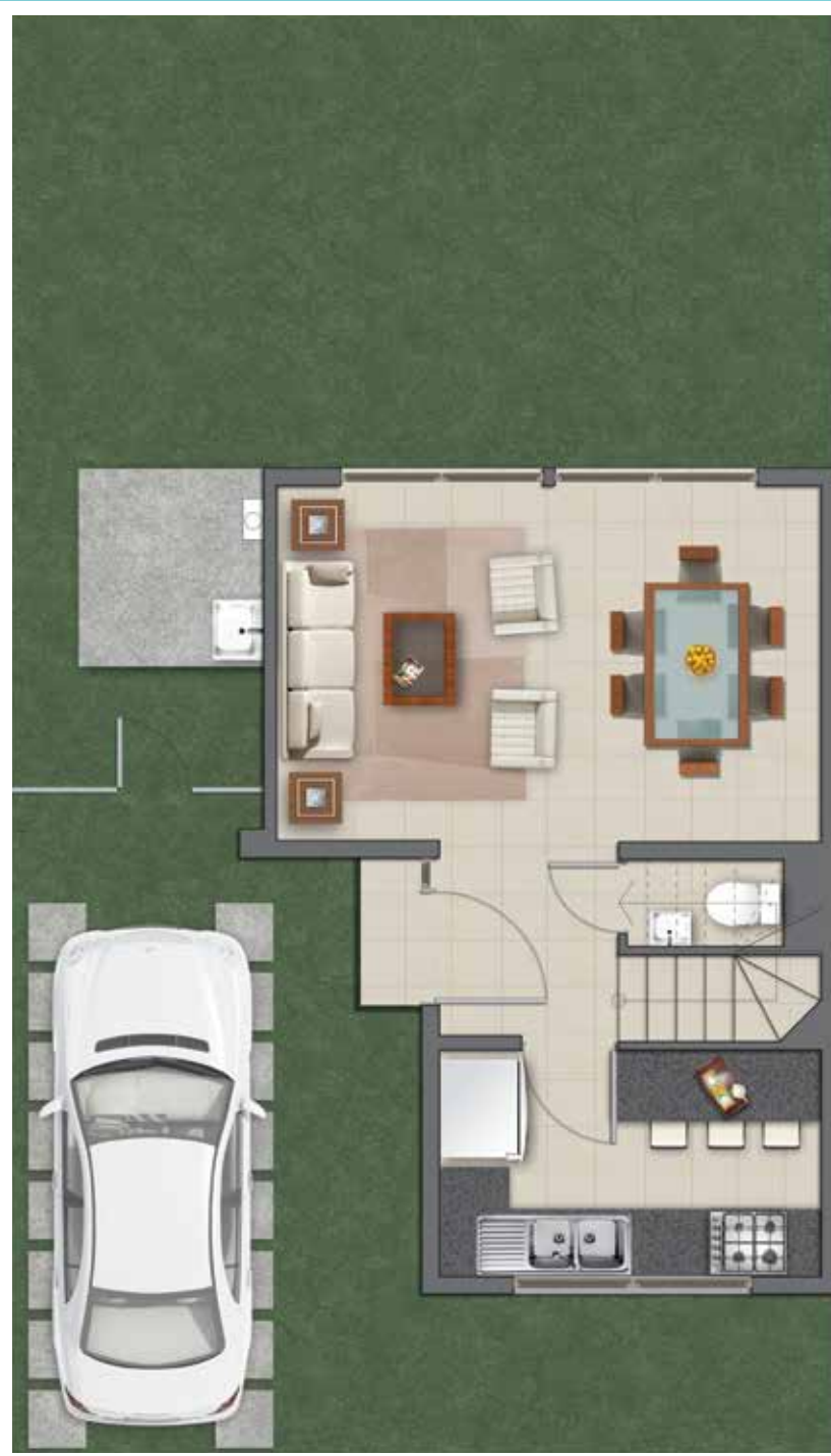
Sup. 1er Piso