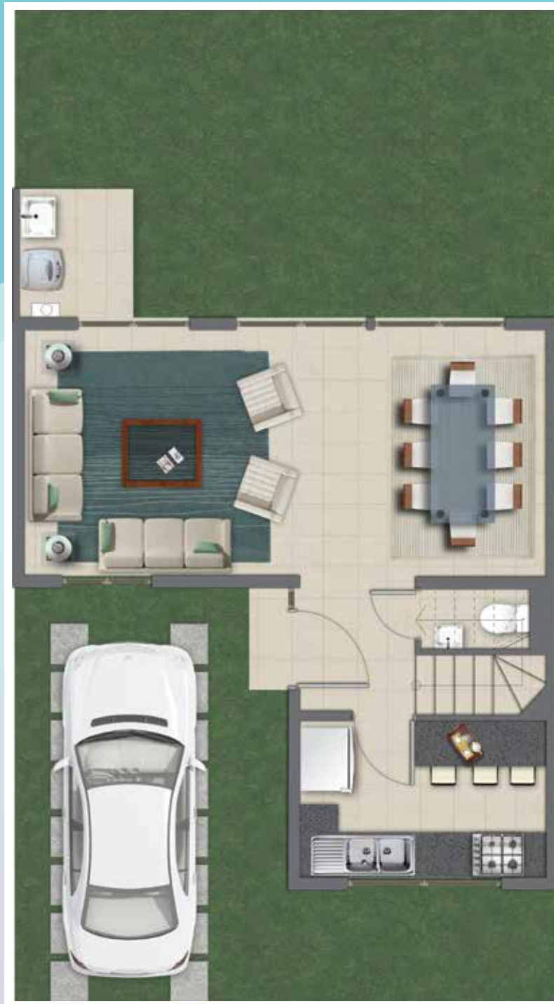
Sup. 1er Piso