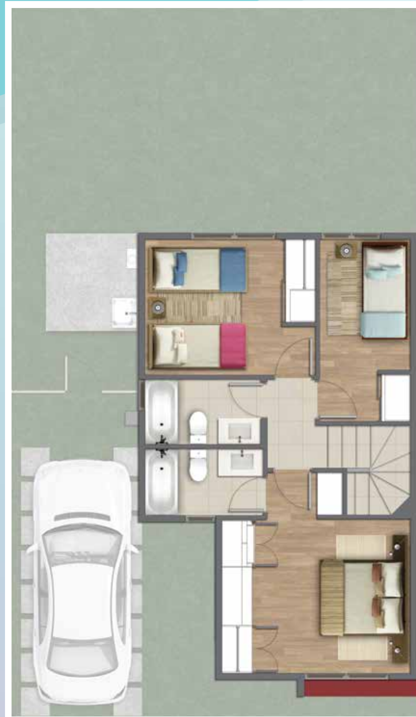
Sup. 2do Piso