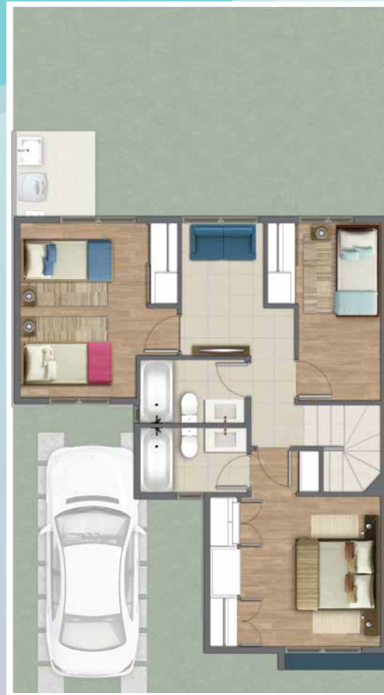
Sup. 2do Piso